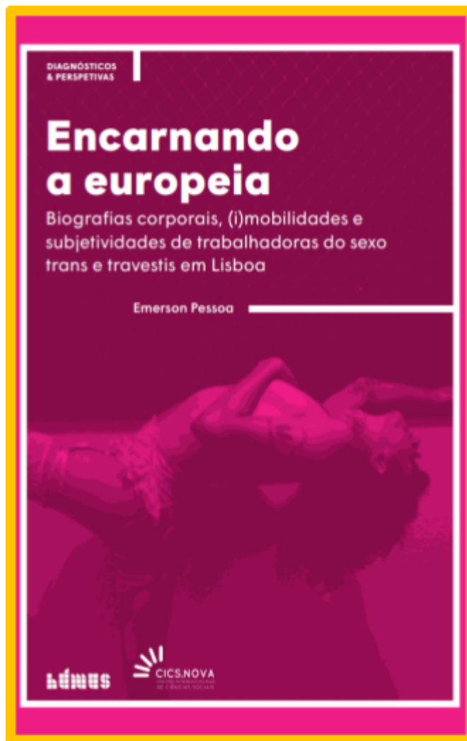
Capa do livro "Encarnando a europeia", de Emerson Pessoa

trabalho do sexo. Em “Encarnando a europeia: biografias corporais, (i)mobilidades e subjetividades de trabalhadoras do sexo trans e travestis em Lisboa” (2024), busquei compreender como trajetórias de vida, desigualdades sociais, suporte familiar, escolarização, racialização, geração, migração e acesso a biotecnologias produzem diferentes modos de viver, narrar e negociar o corpo. Um cuidado central dessa pesquisa foi não reduzir travestis e mulheres trans à vulnerabilidade. A vulnerabilidade existe, é cotidiana e precisa ser enfrentada. Entretanto, ela não explica, sozinha, quem são essas pessoas. Pelo contrário, a vulnerabilidade é fabricada na combinação entre expulsões familiares, violências escolares, barreiras no mundo do trabalho, racismo, transfobia, ausência de