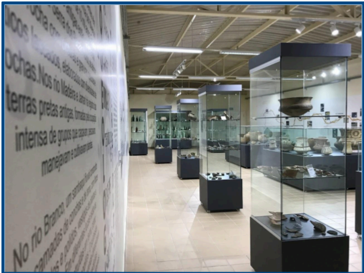
Exposição Arqueologia e Diversidades: 10 mil anos de história no rio Madeira

Neste contexto, o Curso de Arqueologia da UNIR atua como uma Instituição de Guarda e Pesquisa (IGP), cadastrada em âmbito federal no Instituto do Patrimônio Histórico e Artístico