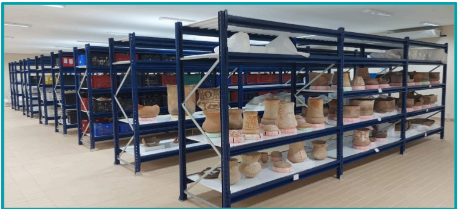
Reserva Técnica Visitável do Curso de Arqueologia da UNIR / Divulgação: Curso de Arqueologia da Universidade Federal de Rondônia

A Reserva Técnica do Curso de Arqueologia da UNIR, é um exemplo desse movimento contemporâneo. Com mais de mil metros quadrados, o espaço abriga acervos provenientes de centenas de sítios arqueológicos distribuídos por diferentes regiões de Rondônia, reunindo uma expressiva diversidade de