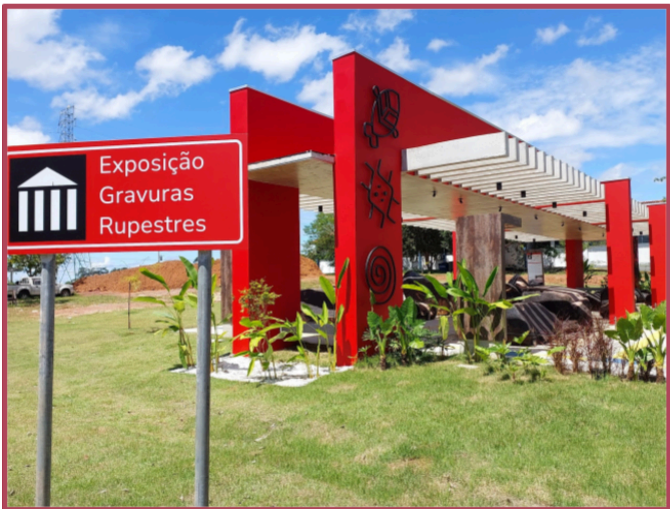
Exposição Gravuras Rupestres na Universidade Federal de Rondônia - Campus Porto Velho / Divulgação: Curso de Arqueologia da Universidade Federal de Rondônia

termo técnico atribuído a essa tipologia de bens arqueológicos varia entre gravura, grafismo, petróglifo, entre outros. As temáticas identificadas incluem representações humanas, de animais, plantas e formas