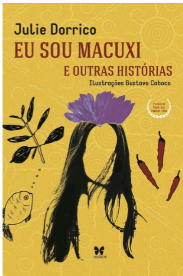
Capa do Livro "Eu sou macuxi e outras histórias" / Editora: Caos e Letras

Todas as vezes que falamos invoco o que chamo de “enunciação a dois mundos”, isto é, o mundo indígena e o mundo não indígena.