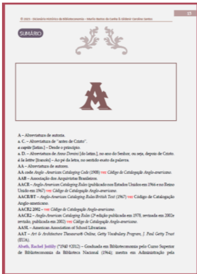
Seção “A” do e-book: “Dicionário histórico da Biblioteconomia”

Divulga-Ci , Porto Velho, v. 4, n. 3, p. 1-8, mar. 2026. ISSN: 2965-3436