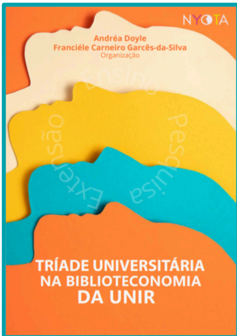
Capa do E-book "Tríade Universitária na Biblioteconomia da UNIR"

O estudo sobre mediação da informação aprofunda o entendimento desse processo como prática social que conecta pessoas, contextos e sentidos. Ao discutir dimensões teóricas e aplicações práticas, a pesquisa demonstra que mediar informação não é apenas transmitir