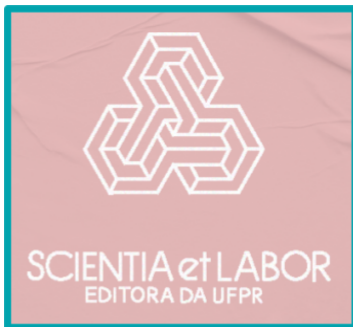
Antiga logomarca da editora universitária da Universidade Federal do Paraná