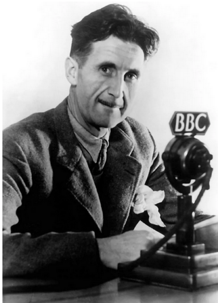
Entrevista com George Orwell na BBC em 1940

O estudo citou o conceito de “pós-verdade” como exemplo, destacando como fatos objetivos se tornaram menos influentes na formação da opinião pública do que apelos emocionais ou crenças pessoais. Esse termo ganhou destaque em 2016, durante a eleição de Donald Trump e o Brexit, ambos marcados pela disseminação de notícias falsas. A descentralização da informação, facilitada pelas redes sociais, permitiu que qualquer pessoa compartilhasse suas visões de mundo, muitas vezes sem verificação, contribuindo para o abandono da verdade.