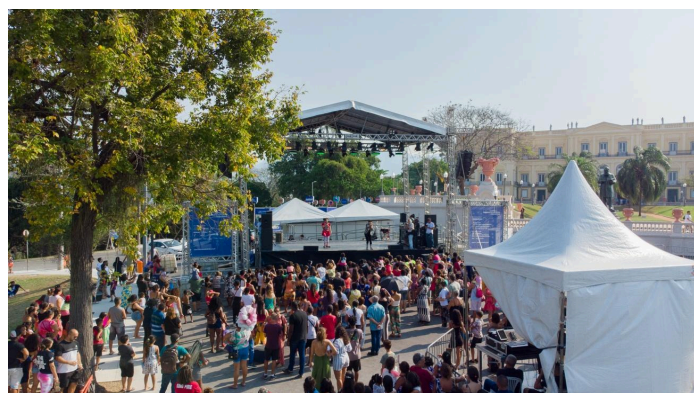
Evento cultural e educativo em comemoração aos 206 anos do Museu Nacional ocorrido em 9/6/2024 na Quinta da Boa Vista/RJ.