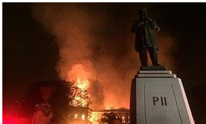
Incêndio que destruiu o Palácio de São Cristóvão, sede do Museu Nacional (2/9/2018).

Além disso, como instituição que se aproximou das teorias do evolucionismo como princípio orientador de suas pesquisas e trabalhos, e que promoveu a disseminação de ideias científicas, o Museu Nacional contribuiu para afirmar o pensamento iluminista, racional e científico como a forma mais acabada de explicação dos fenômenos naturais e sociais.