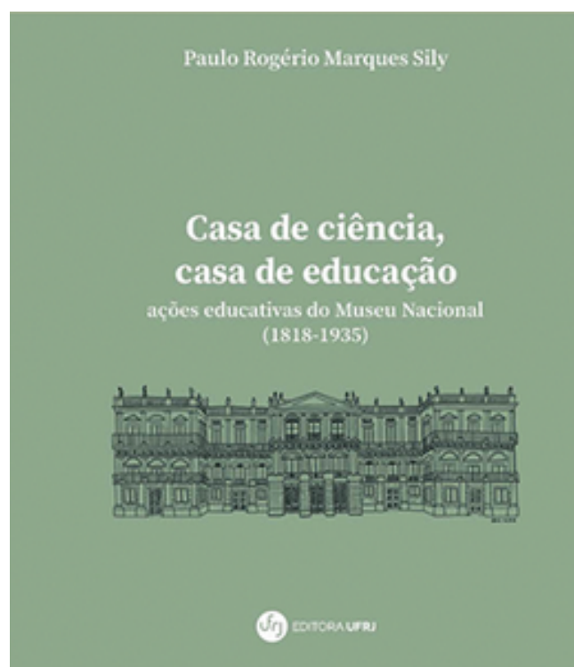
Capa do livro: Casa de Ciência, Casa de Educação: ações educativas do Museu Nacional (1818–1935)

atingida pelo fogo) foi possível realizar pesquisas durante curso de Doutorado em História da Educação, na Faculdade de Educação da Universidade do Estado Rio de Janeiro (UERJ) que resultaram na tese intitulada Casa de Ciência, Casa de Educação: ações educativas do Museu Nacional (1818–1935). Defendida