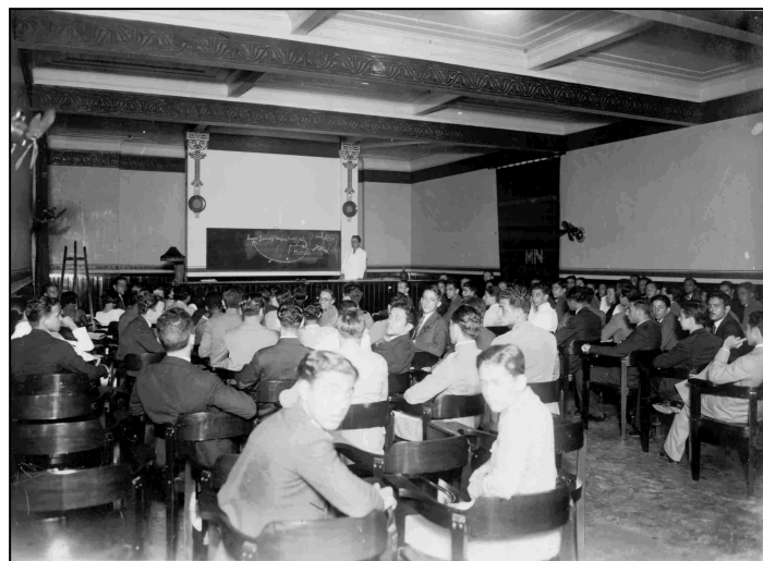
Sala de Cursos do Museu Nacional em funcionamento na década de 1920.

pertencimento, de identidade nacional de uma nação em construção.